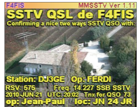
Bild 11: Das Schöne an SSTV: Man bekommt die QSL-Karte gleich live zu sehen.