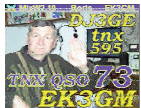
Bild 14: Dieses QSO mit EK3GM konnte anschließend in SSB mit 5 W und derselben Antenne sicher abgeschlossen werden. Die Entfernung betrug rund 3000 km.