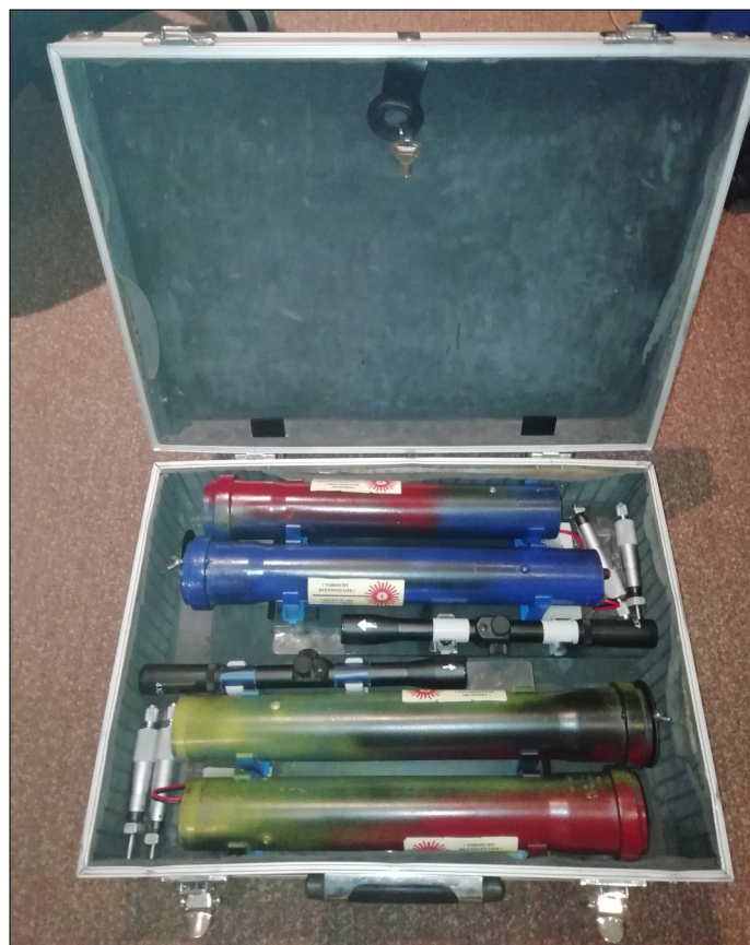
Bild 6: Die Lichtsprec- hgeräte lassen sich für den Transport in ei- nem Aluminiumkof- fer unterbringen.