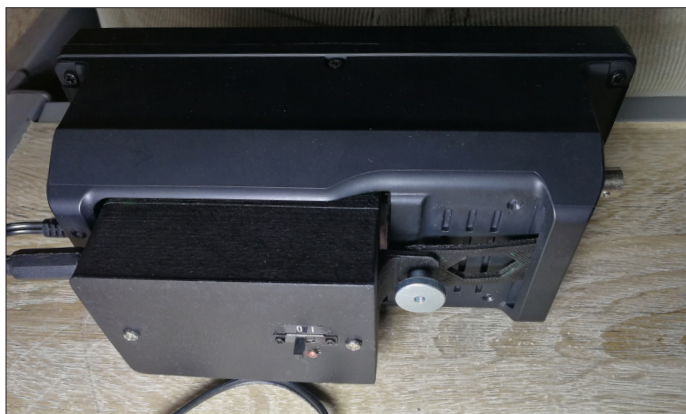
Bild 1: Befestigung des Akkumulatorgehäus es auf der Rückseite eines Icom IC-705

Ergänzend zum Beitrag präsentieren wir hier noch einige Bilder, die in der gedruckten Ausgabe leider keinen Platz mehr fanden.